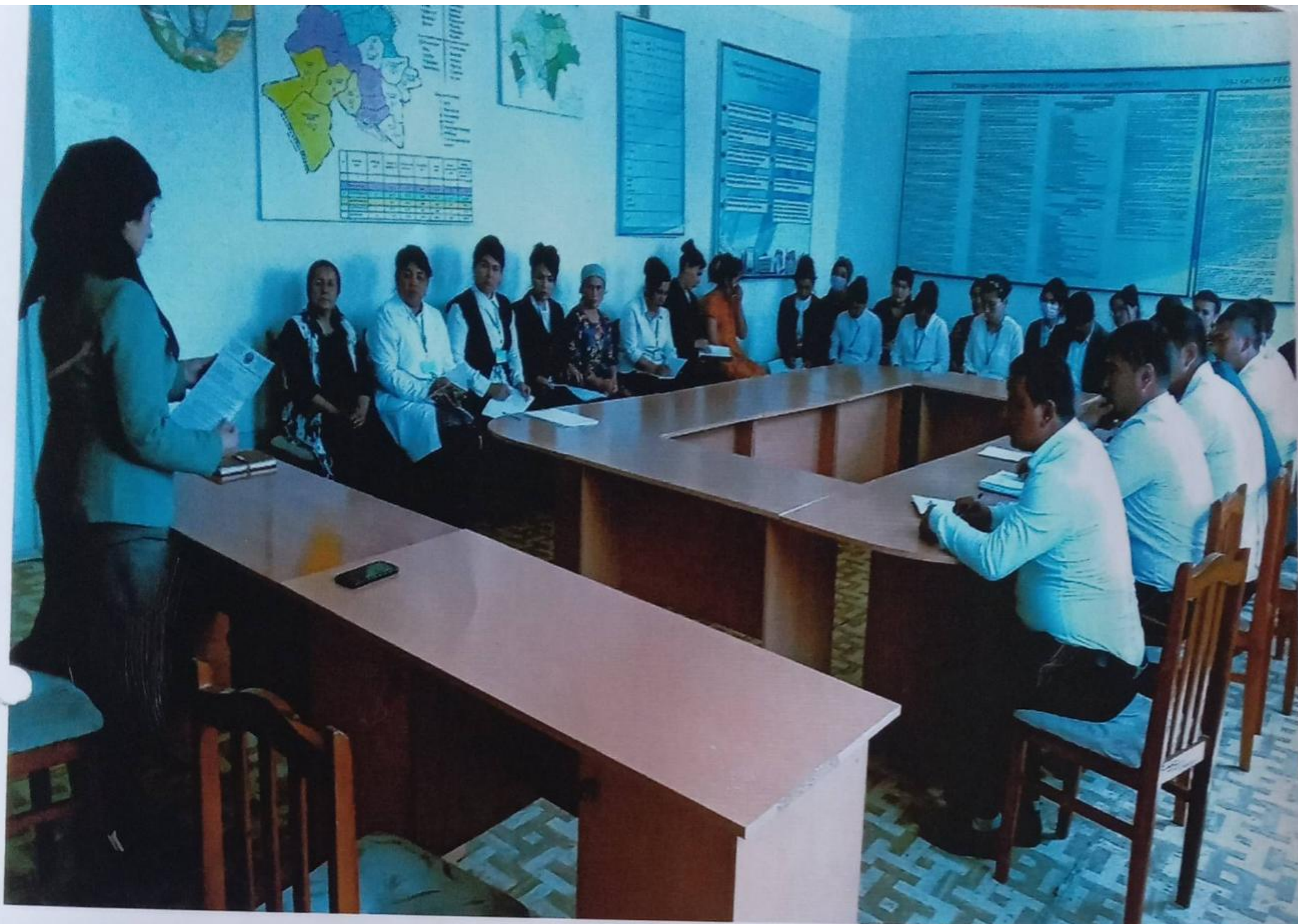
Улуғнор касб – ҳунарга ўқитиш марказида порахўрлик ва коорупциянинг олдини олиш юзасидан педагог жамоа ўртасида ўтказилган умумий йиғилишдан фото лавҳа